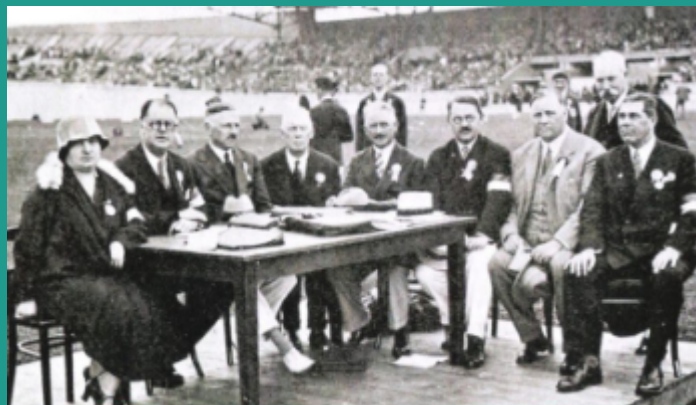
Alice Milliat, membre du jury des épreuves d'athlétisme aux Jeux Olympiques d'Amsterdam en 1928.

Le succès de ces « Jeux Olympiques Féminins » est tel que le CIO autorise enfin les femmes à concourir dans le sport-roi de l'olympisme moderne : l'athlétisme. Les premières athlètes y participeront à partir des Jeux Olympiques d'Amsterdam en 1928. Alice Milliat sera d'ailleurs invitée au jury des